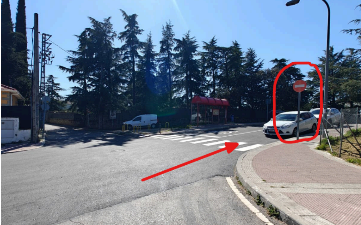
(Foto 5: Fotografía donde se observa la existencia de señalización vertical de prohibido en C/ San Antonio en su cruce con C° de los Enebrales y C/ Playa Samil que contradice la señalización en suelo recientemente pintada de línea continua en C/ San Antonio delimitando la existencia de dos sentidos de circulación)