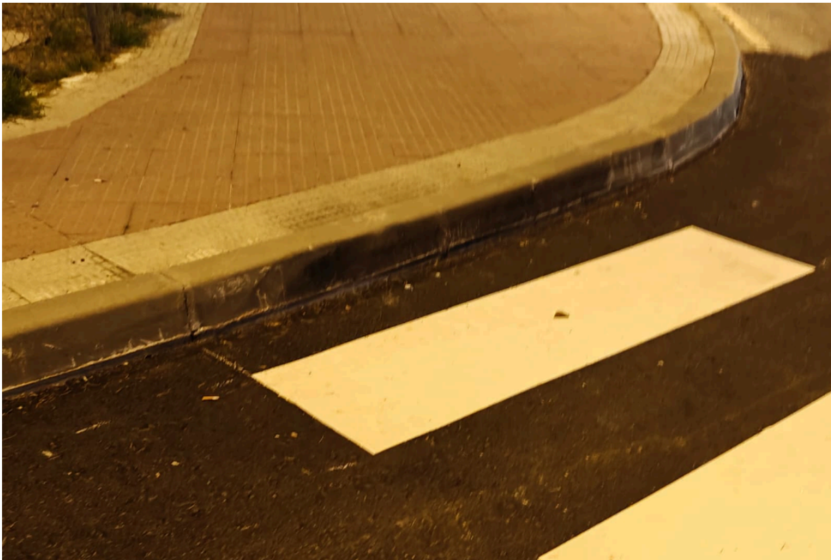
(Foto 6: Fotografía donde se observa la ausencia de rampa o rebaje en la acera que permita la accesibilidad a personas con movilidad reducida en el cruce de C/ San Antonio con C/ Playa Samil y C° de los Enebrales)