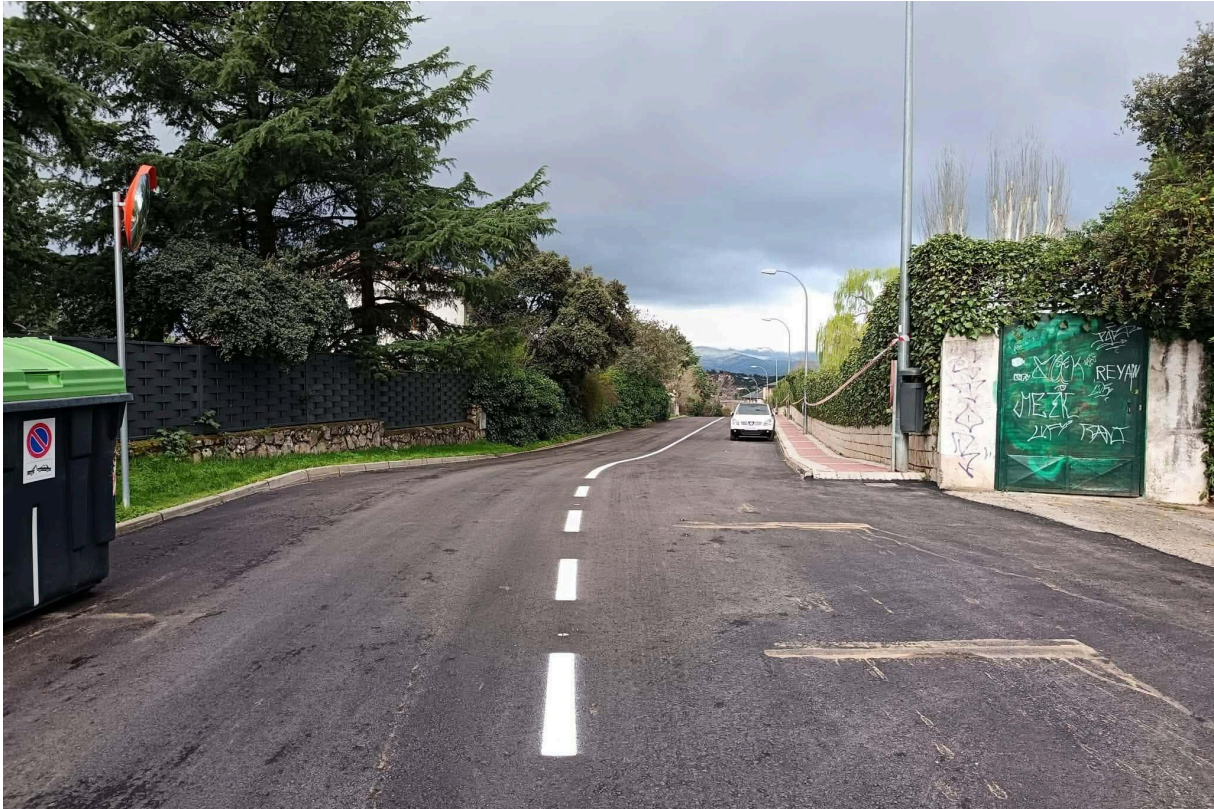
(Foto 3: Fotografía donde se observa el repintado con línea continua)