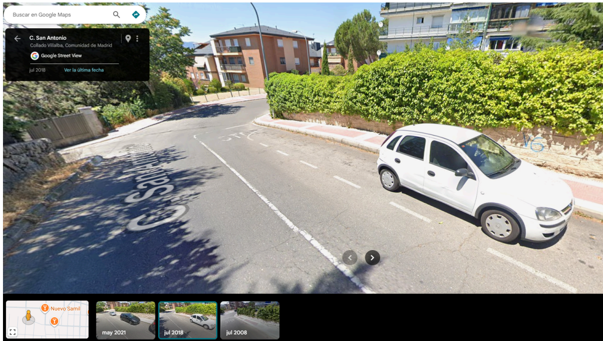
(Foto 1: Imagen de Google Street View del año 2018 donde se puede observar el aparcamiento ya existente en la C/ San Antonio)