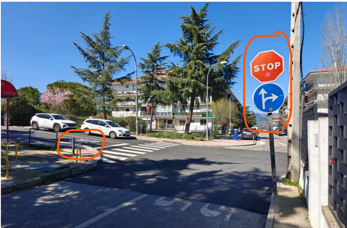
(Foto 4: Fotografía donde se observa la duplicidad contradictoria de señalización vertical de Stop en C° de los Enebrales con señalización reciente en suelo de Stop en C/ San Antonio; además de señalización vertical en C° de los Enebrales que impide el giro a la izquierda)